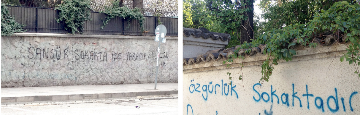
Fotoğraf 2.: Şehirde duvar yazıları: 'sansür sokakta işe yaramaz!' ve 'özgürlük sokaktadır'

Sokak her zaman kentlinin isteklerini, söylemlerini dışa vurmak için kullandığı uzam olmuştur. Aynı zamanda siyasi erke cevap vermek, sesini duyurmak için de sokağı kullanır.